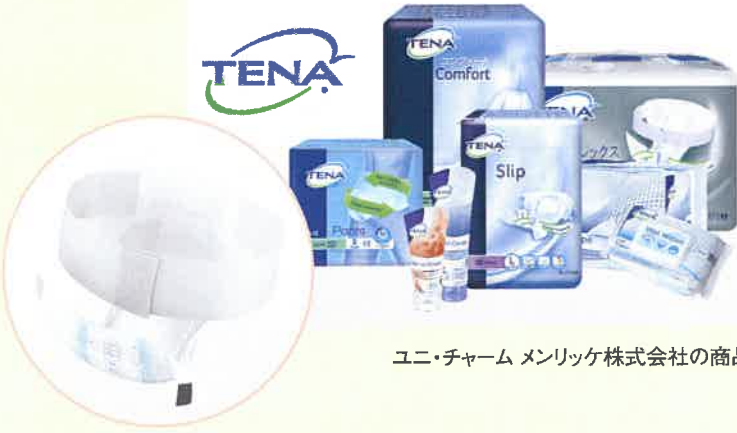
ユニ・チャーム メンリック株式会社の商品

の尊厳を大切にするためにできるだけ下着に近いもので今まで通りの生活を続けていってほしいという思いがあるからです。利用される方に快適なつけ心地を提供するために、それをサポートする施設スタッフの方々に対して勉強会やワークショップを行い、排便ケアのアセスメントを行っています。まずは、排泄委員会を設置し、排便ケアの仕方を標準化することでスタッフ全員が同じケアをできるようにしていく。そのあとはさらに一歩進んで個別ケアを行います。その成果をセミナーやフォーラムでの発表などを行うことで、スタッフの方々のやりがいにもつながっていかばと考えています。