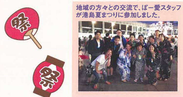
地域の方々との交流で、ぼ一愛スタッフが港島夏まつりに参加しました。