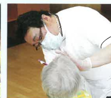
週に1回行われる訪問診療の様子