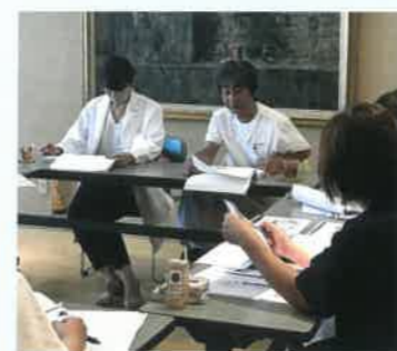
歯科医師を交えた口腔ケアの講習会

ご高齢の方にとって口腔ケアは様々な病気の予防にもつながる重要なものです。ぼ一愛では、利用者様に合ったケアができていないのか、ケアは統一されているのかといったところに注目し、その改善について取り組みました。肺炎などで入院される方もあり、口腔内感染予防に対する意識を高める必要もあると感じました。また、歯科医師にもご協力頂き、定期的に講習会を開催することで、正しい歯の磨き方、口腔内観察の方法を学びスタッフのスキルアップをはかりました。