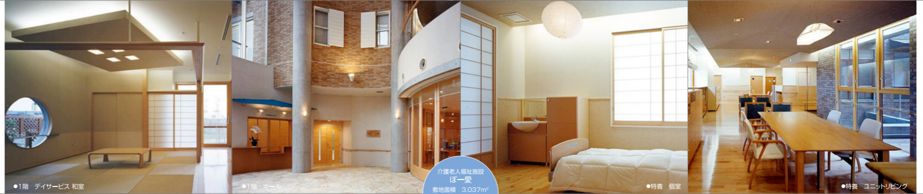
●1階 デイサービス 和室