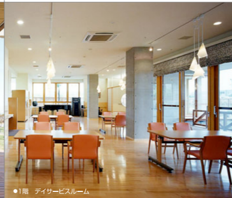
●1階 デイサービスルーム